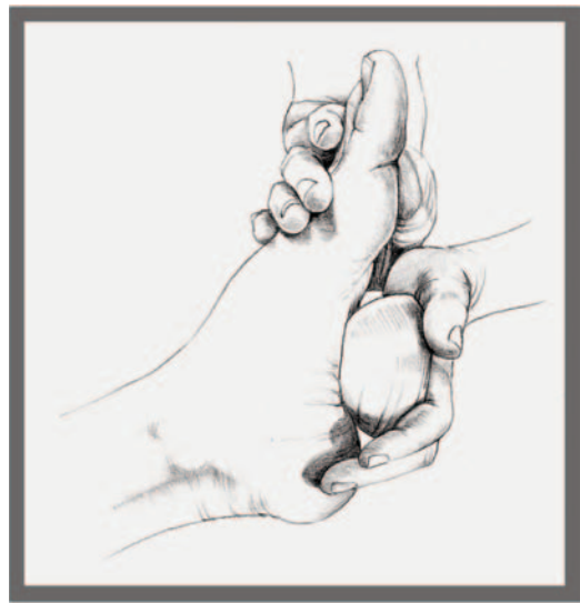
Kasa: Kasa Bowl in Use / Utilisation du bol Kasa.

Marma therapy is used to detoxify, tonify and rejuvenate. "Treating them (marmas) can release negative emotions and remove mental blockages, including those of a subconscious nature (like addictions). This means that there